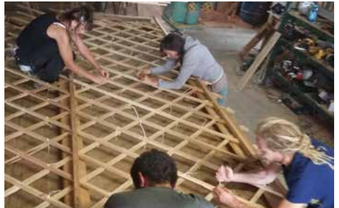
Fabrication d'un treillis