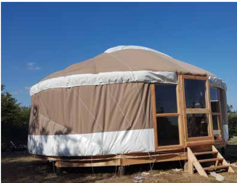
Ventaux en verre