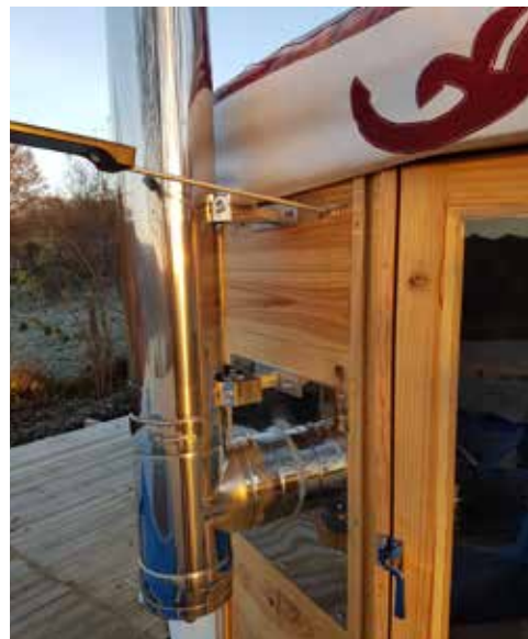
Sortie de poêle