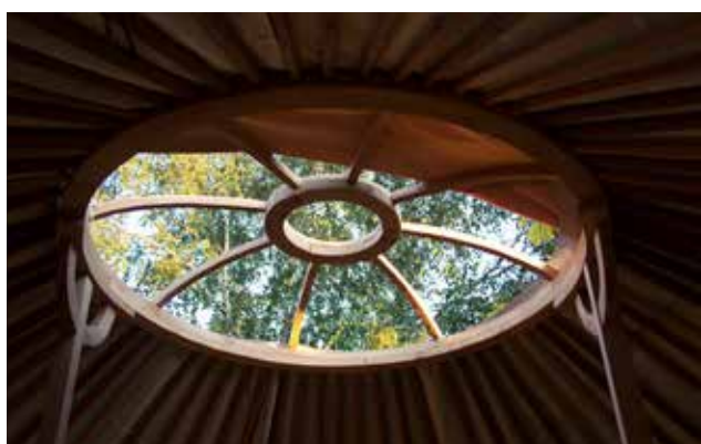
Le toono ouvert