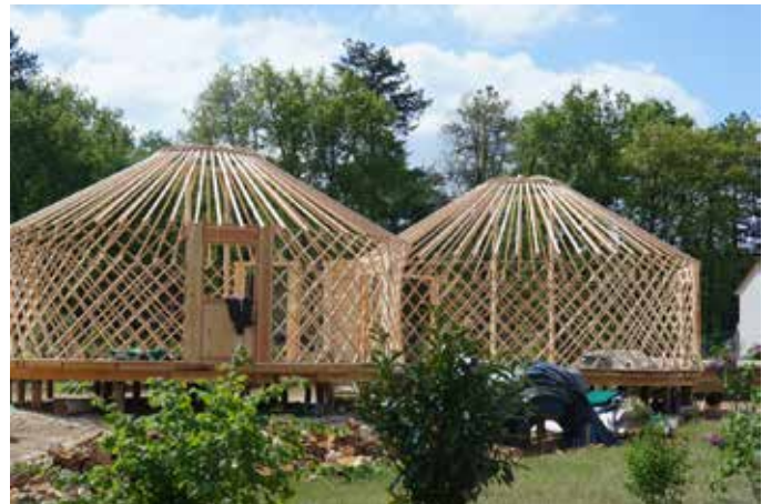
Double yourtes atachées