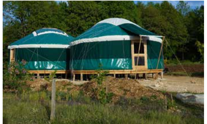
Double yourtes atachées toit pvc