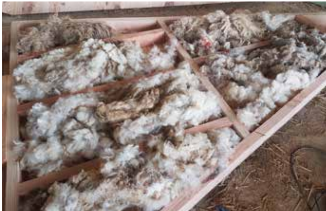
Isolation en laine de mouton brut