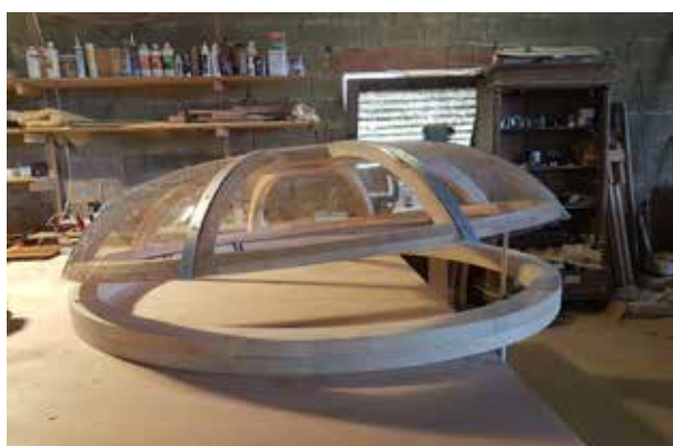
toono ouvrant en Altuglass 2mm