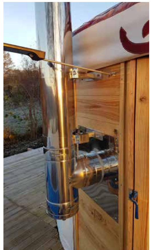
Ventail bardé pour sortie de poëlle