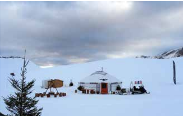
A 2700 m à val d'Isère