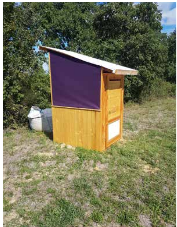
cabanon toilette sèche ou douche