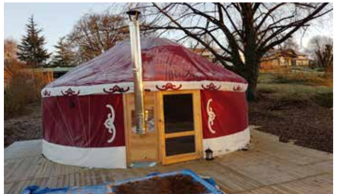
Sortie de poêle