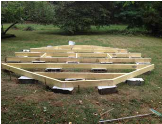
Solivages bas 5x15cm