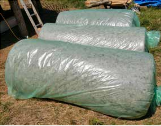
Isolant laine ou isolant coton Metiss©