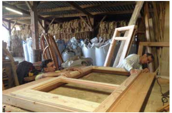
Fabrication des portes