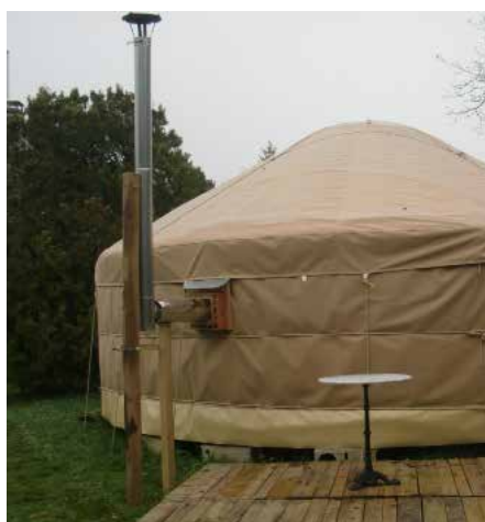
Sortie de poelle