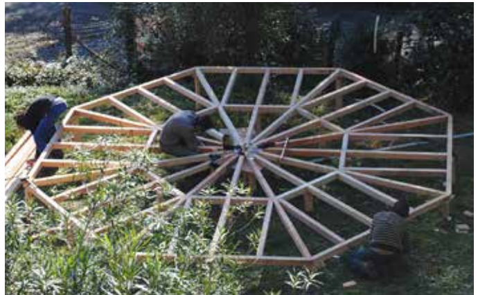
Plancher en étoile