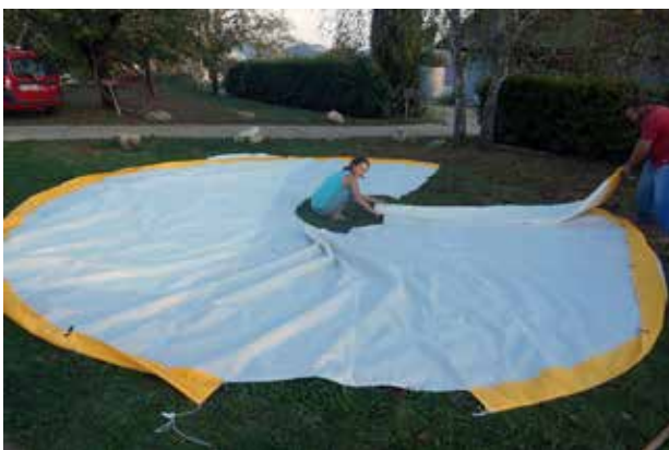
Pliage du toit