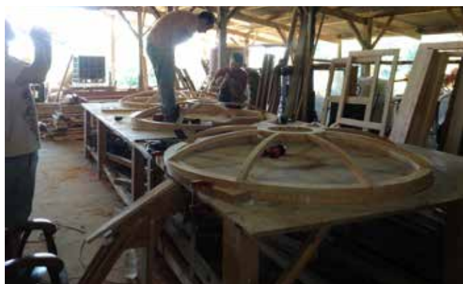
enfilade de toono