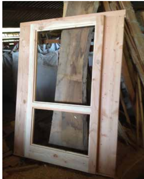
Une porte fini, ou presque !