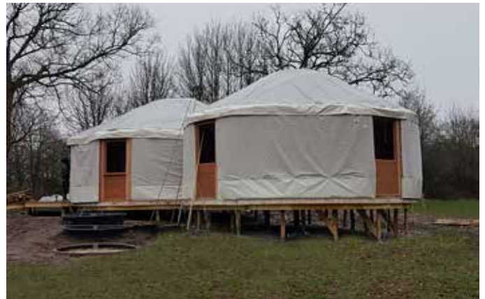
Double yourte avec fenêtres