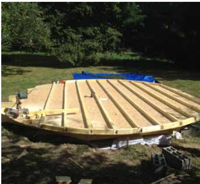
Solivage haut + osb, prêt à mettre l'isolation