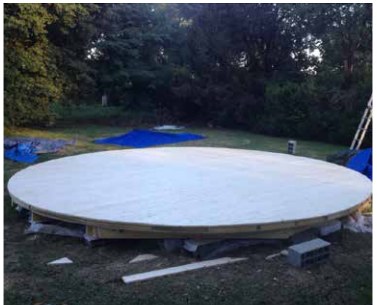
Parfaitement rond, la yourte peut être posée