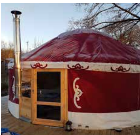
Sortie de poêle