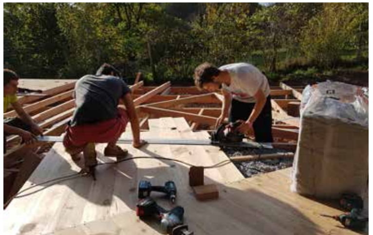
Pose du plancher en étoile (très long à faire mais très beau)