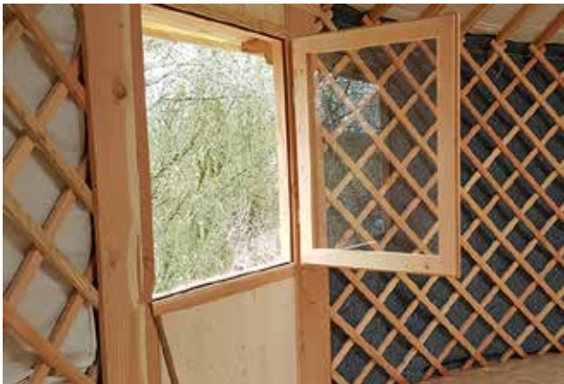
Fenêtre verticale ouverture interieur