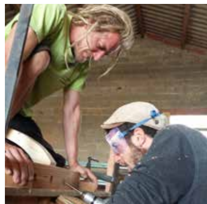
Percage du toono