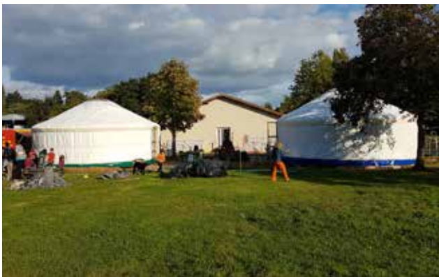
Les 2 yourtes écoles