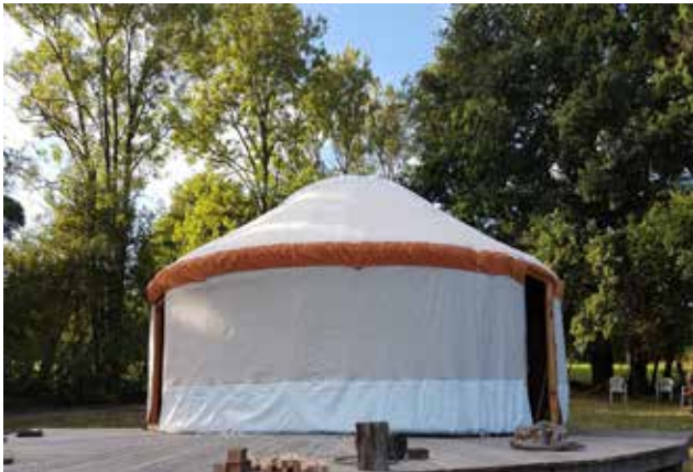
yourte de 6.5 m