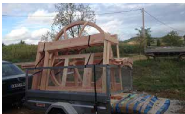
Structure bois dans une petite remorque hors isolant