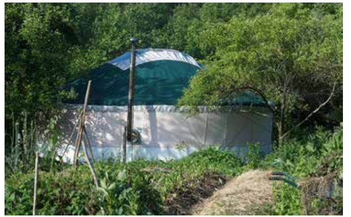
Bien caché !