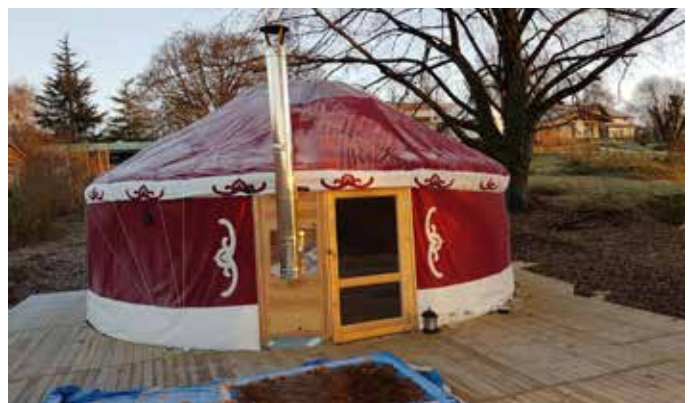
Sortie de poêle