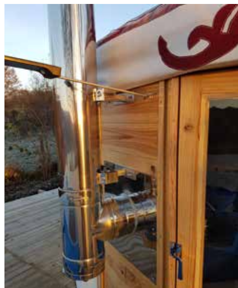
Sortie de poêle